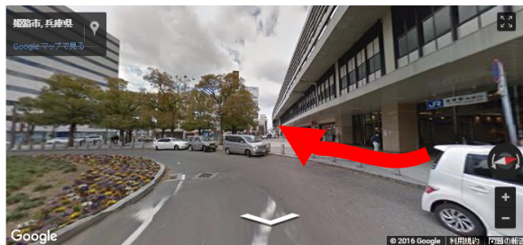
姫路駅「南口」を出て西方向へ約50m

バスは完全予約制です お席には限りがございますのでご希望通りご乗車 いただけない場合もございますので予めご了承ください