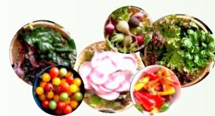
新鮮野菜のサラダ ※旬の野菜や珍しい野菜