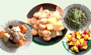
季節のお惣菜5種 ※日替わり