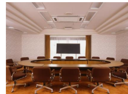
写真のレイアウトはロノ字です

広さ 舞台 無し タイプ 洋：じゅうたん MAX 洋：イステーブル スクール形式 30名