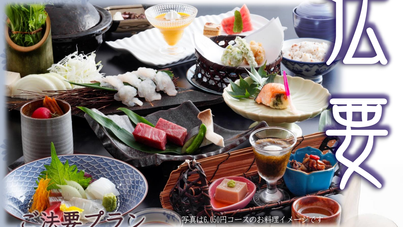
写真は6,050円コースのお料理イメージです